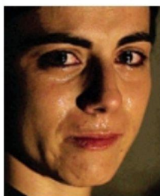
A teatro «Demoni - Frammenti»

venerdì con un massimo di sei spettatori per replica. L'adattamento di «Frammenti» de «I demoni» di Dostoevskij riesce a catturarne l'essenza, concentrandosi sulla figura di Nikolaj Stavrogin, il personaggio profondamente tormentato attor-